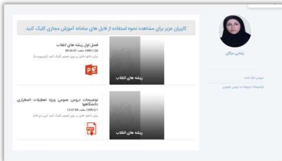
تصویر ۴. صفحه اصلی استاد در سامانه آموزش مجازی

با کلیک بر روی دگمه جستجو، صفحه استاد نمایش داده می شود. با کلیک بر روی صفحه وب می توانید وارد صفحه وب استاد شده و دروس ارائه شده توسط استاد را مشاهده نمایید. (تصویر ۴)